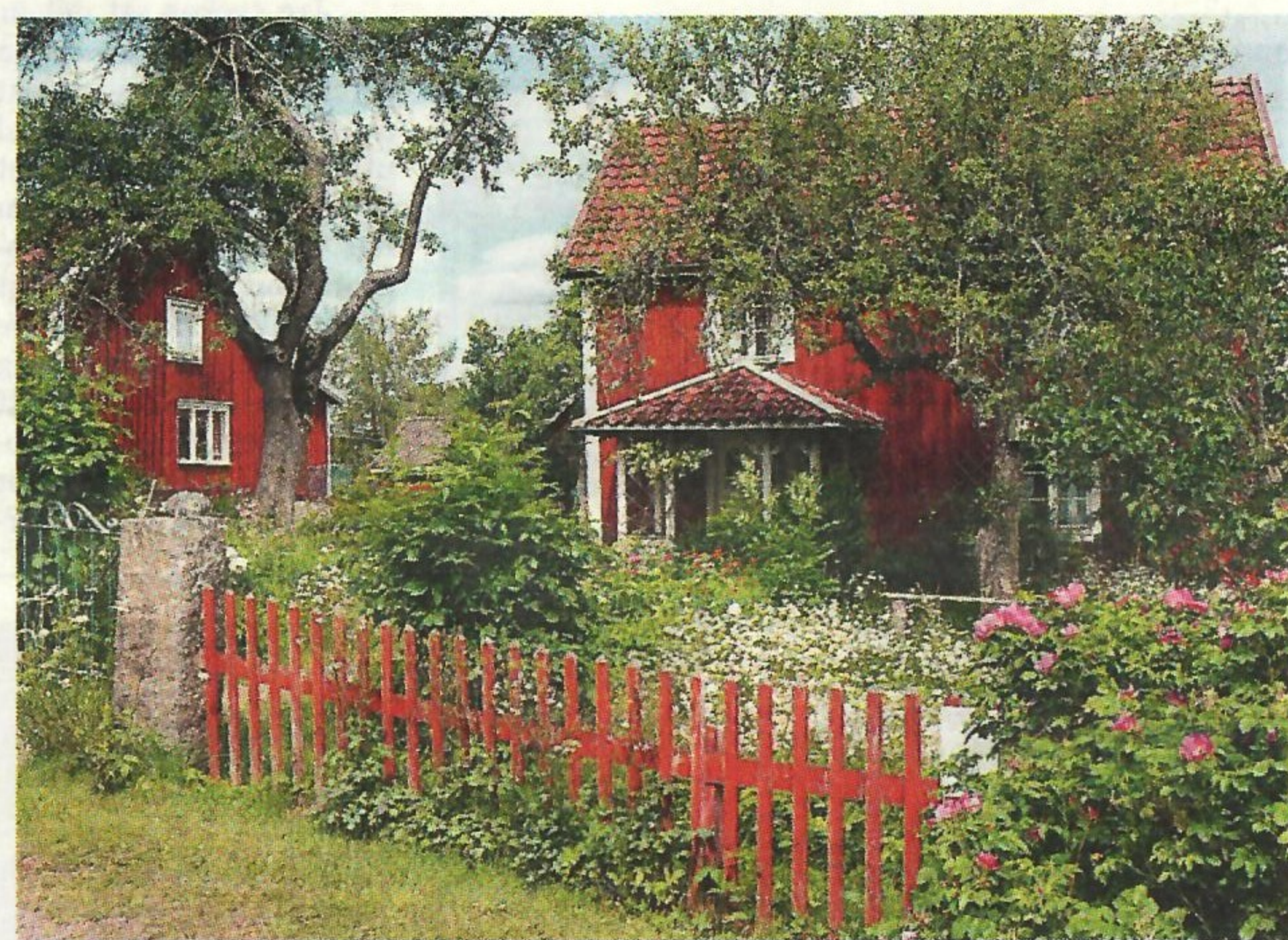
Mellangården i Bullerbyn. Många hamnar förstås här. I boken finns tips på hur man kan fylla en hel dag, där Bullerbyn är en anhalt.